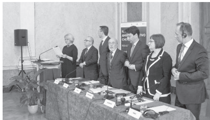
Sudionici godišnjih upravnopravnih susreta Sjevernojadranske euroregije